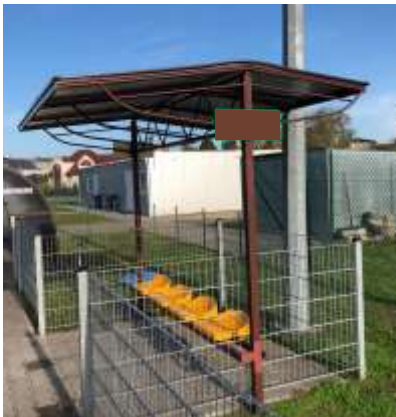
*fotografia stanowi wyłącznie obraz poglądowy zadania.